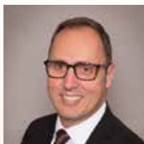
Thorsten Eberhard Bürgermeister der Stadt Nidda